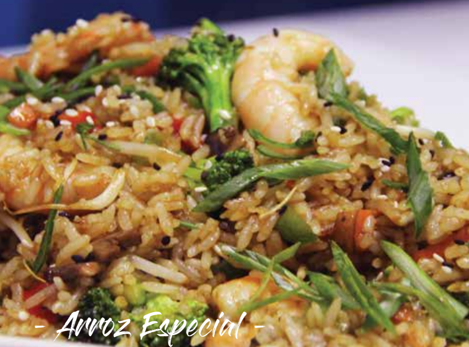
- Arroz Especial -