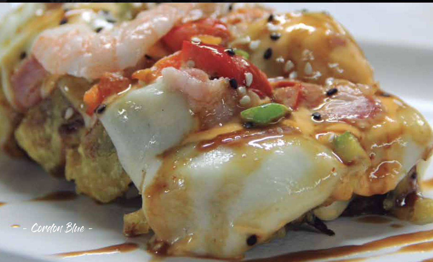
- Cordon Blue -

Champiñon, esparragos, espinaca, morrón capeado, queso gratinado, aguacate por fuera.