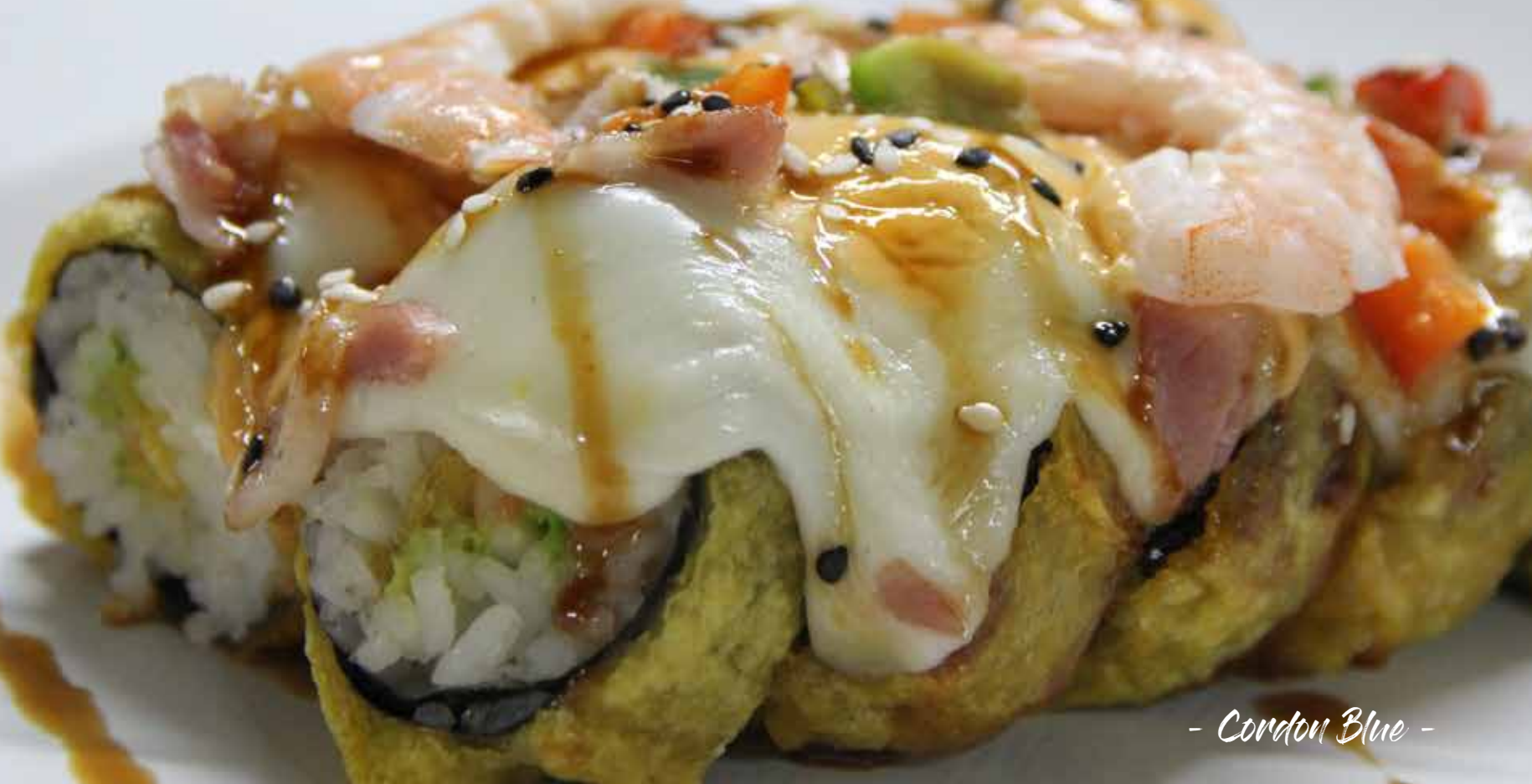
- Cordon Blue -