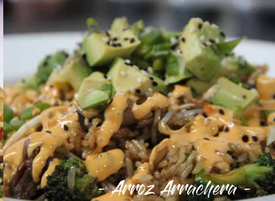
- Arroz Arrachera -